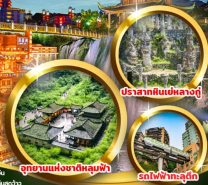
ปราสาทหินเย่หลางกู่