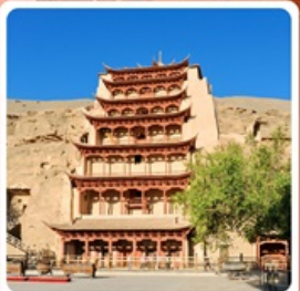
กำแพงเกาหลู