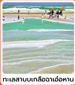
ทะเลสาบเกลือจาเอ้อฮาน