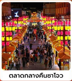
ตลาดกลางคีนซาโจว