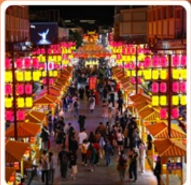
ตลาดกลางคืนซาโจว