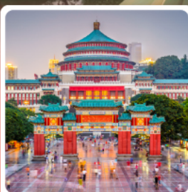
ศาลาประชาชน