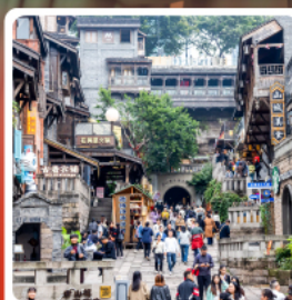
ถนนคนเดินสี่牌坊