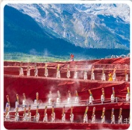
Impressions of Lijiang