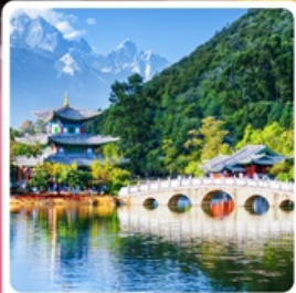
สระมิงกรต้า