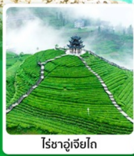
ไร่ชาอู่เจียโต