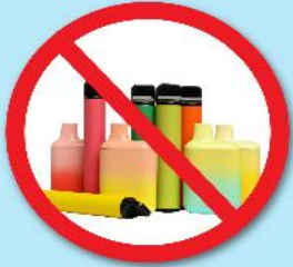
ปืนไฟฟ้า บุหรี่ยุติไฟฟ้า