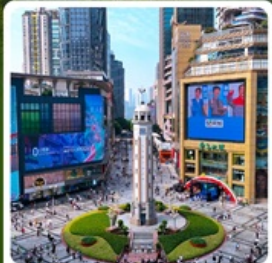
ถนนเจียฟางเป่ย์