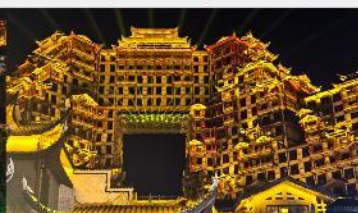
ตีทมหัทศวรรษ 72