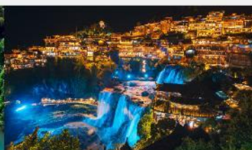
หมู่บ้านโบราณผู้หลงเจิน