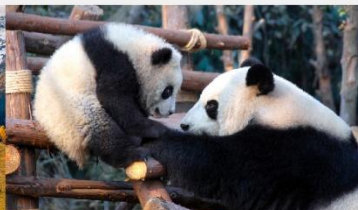
หุบเขาแพนด้าตูเจียงเอี้ยน