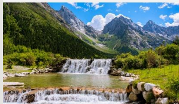
อุทยานแห่งชาติปี้เฟิงโกว