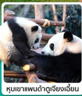
หุบเขาแพนด้าตู่เจียงเอี้ยน