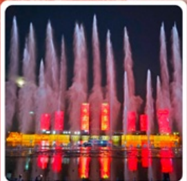
น้ำพุคังปาสือ