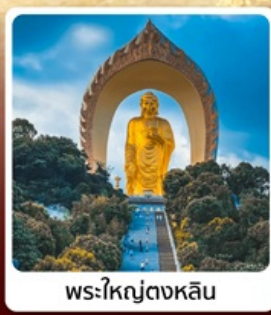
พระใหญ่ตงหลิน