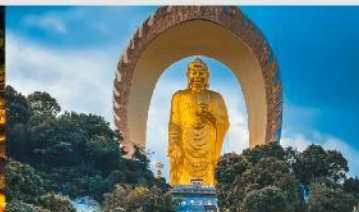
พระใหญ่ตงหลิน