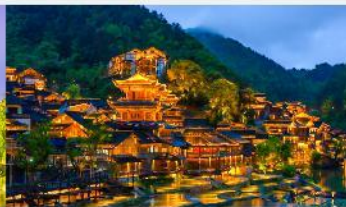
หมู่บ้านโบราณวูเจียงจ้าย