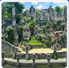
ปราสาทหินเย่หลางกู่