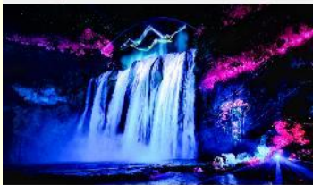
อุทยานน้ำตกหวงกั๋วซู่