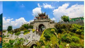
เมืองโบราณซิงเหยียน

*ทางบริษัทฯ ขอสงวนสิทธิ์ในการสลับโปรแกรมทัวร์ตามความเหมาะสมขึ้นอยู่กับสถานการณ์หน้างาน โดยคำนึงถึงผลประโยชน์ของลูกค้าเป็นสำคัญ