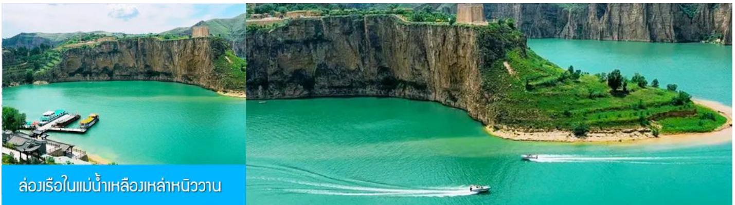
ล่องเรือในแม่น้ำเหลืองหล่าหนิววาน

รับประทานอาหารกลางวัน ณ ร้านอาหารระหว่างทาง (8)