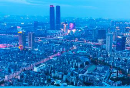
นครคุนหมิง