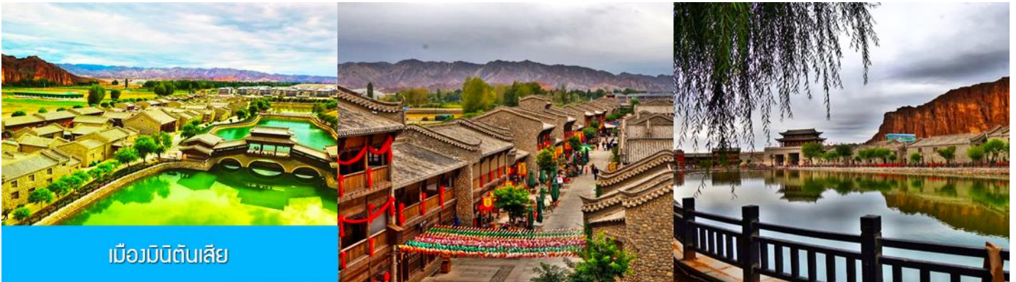
เมืองมินิดินสี