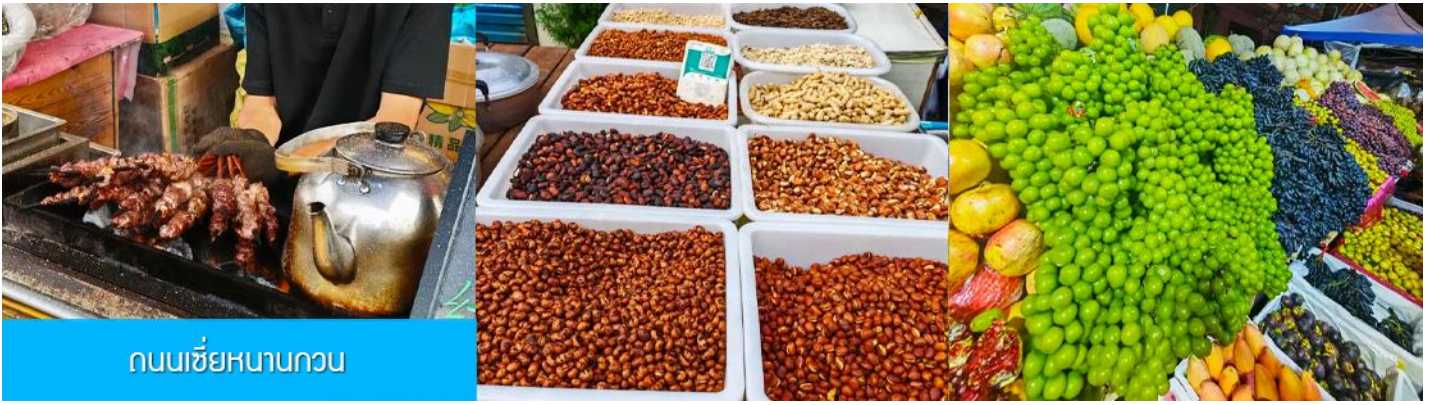
ถนนเซี่ยหนานกวน