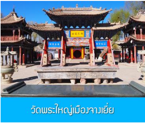
วัดพระใหญ่เมืองจางเยี่ย