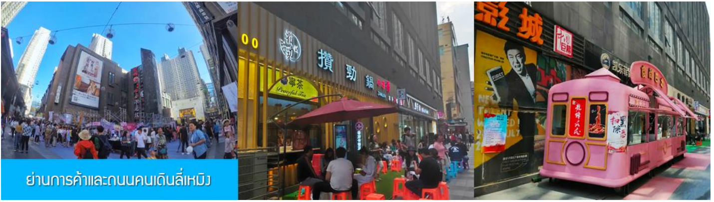
ย่านการค้าและถนนคนเดินลี่หมิง

หลังอาหารนำท่านสู่ ย่านการค้าและถนนคนเดินลี่หมิง 力盟商业步行街 ย่านการค้าทันสมัยที่มีห้างสรรพสินค้าขนาดใหญ่หลายแห่ง ถนนคนเดินที่คึกคักไปด้วยร้านค้าแบรนด์ท้องถิ่น ร้านอาหารพื้นเมือง ร้านสะดวกทานฟาสต์ฟู้ด ให้อาหารอิสระท่านเดินช้อปปิ้ง ชิมอาหารพื้นเมืองเต็มที่