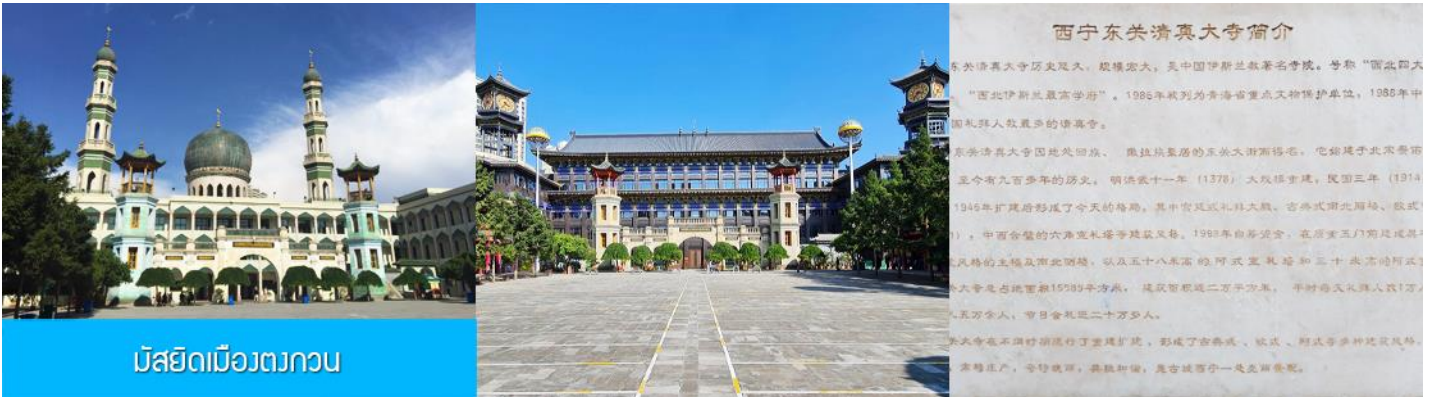
มัสยิดเมืองตงกวน

เช้า บริการอาหารเช้า ณ ร้านอาหารในโรงแรม (17)