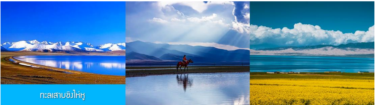
ทะเลสาบชิงไห่หู

นำท่านเดินทางสู่ ทะเลสาบชิงไห่หู (ระยะทาง 150 กม. ใช้เวลาเดินทางราว 2 ชั่วโมงเศษ)