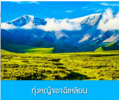
ทุ่งหญ้าฉีเหลียน

จากนั้นนำท่านเดินทางโดยรถบัสสู่ทุ่งหญ้าฉีเหลียน (ระยะทาง 140 กม. ใช้เวลาเดินทางประมาณ 2 ชั่วโมง)