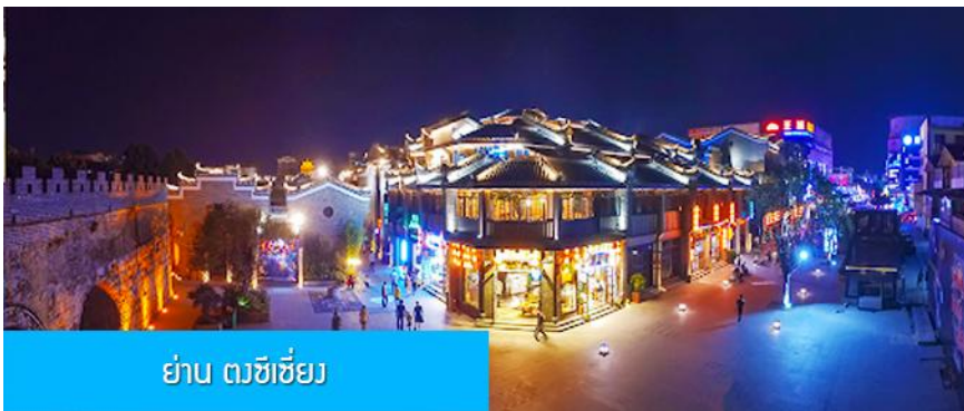
ย่าน ตงซีเซียง

จากนั้นนำท่านเที่ยวชม พิพิธภัณฑ์ดอกกุยฮวา 桂花公社 ดอกกุยฮวาเป็นดอกไม้สีเหลืองที่มีกลิ่นหอม เป็นดอกไม้ประจำเมืองของกุยหลิน จะเบ่งบานในช่วงเดือนมิถุนายน – กรกฎาคมของทุกปี ในช่วงที่ดอกกุยฮวาเบ่งบานในเมืองกุยหลินจะคลุ้งไปด้วยกลิ่นหอมจากดอกกุยฮวา ทั่วเมืองกุยหลินจะเต็มไปด้วยสีเหลืองของดอกกุยฮวา ดอกกุยฮวาสามารถนำมาแปรรูปเป็นอาหารและเครื่องดื่มได้ และได้รับความนิยมจากชาวจีนตอนใต้เป็นอย่างมาก ชมพิพิธภัณฑ์ที่ทันสมัยด้วยระบบจัดแสดงที่ทันสมัย ภายในพิพิธภัณฑ์มีความโอ่อ่า มีการสาธิตและจำหน่ายผลิตภัณฑ์ที่ทำจากดอกกุยฮวา อาทิ ขนมดอกกุยฮวา ชาที่ทำจากดอกกุยฮวา และสินค้าพื้นเมืองอื่น ๆ