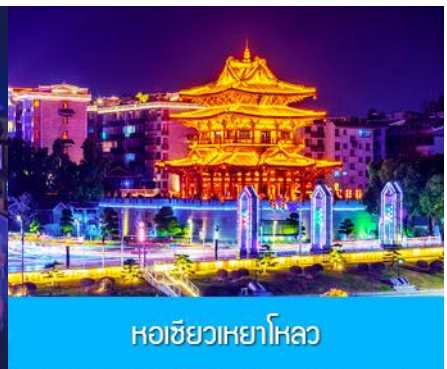
หอชิวเหยาโหลว