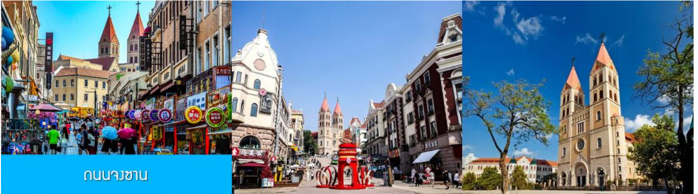
ถนนวงเวียน