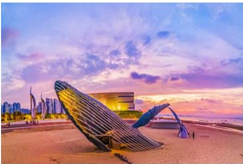
ประติมากรรม วาฬโดดเดี่ยว

จากนั้นนำท่านเดินทางสู่ เมืองเยินไถ 烟台 (ระยะทาง 85 กม. ใช้เวลาเดินทางราว 1 ชั่วโมงเศษ)