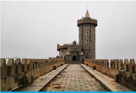
คาเฟ่อีสต