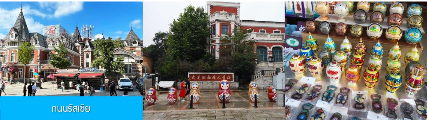
ถนนรัสเซีย

จากนั้นนำท่านขึ้น รถรางไฟฟ้า 有轨电车 เป็นรถรางไฟฟ้าที่สร้างขึ้นในปี ค.ศ. 1909 โดยบริษัทญี่ปุ่น (เมืองต้าเหลียนเคยตกเป็นเมืองขึ้นของญี่ปุ่นในปีค.ศ. 1900 – 1945 ) นำท่านนั่งรถรางโบราณผ่านชมตัวเมืองต้าเหลียนหนึ่งในเมืองแรก ๆ ที่มีบริการรถรางไฟฟ้าเปิดให้บริการในเขตเมือง ปัจจุบันมีเพียงสายที่ยังเปิดให้บริการในเมืองต้าเหลียน.