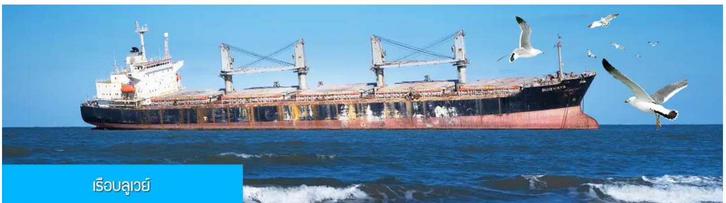
เรือบลูเวย์

เที่ยง รับประทานอาหารกลางวัน ณ ภัตตาคาร (5)