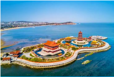
อุทยานท่องเที่ยวแปดเซียนข้ามทะเล