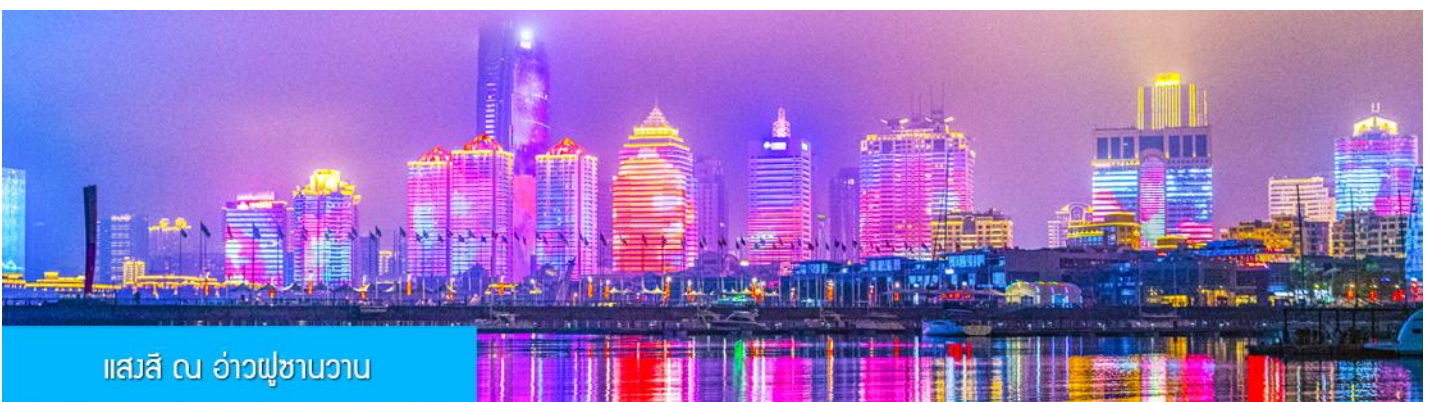
แอสลี ณ อ่าวฟูซานวาน

ค่ำ รับประทานอาหารค่ำ ณ ภัตตาคาร *เมนูซีฟู้ด (3)