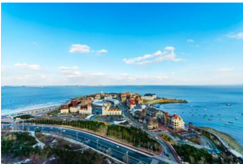
ท่าเรือชาวประมงไห่ซาง