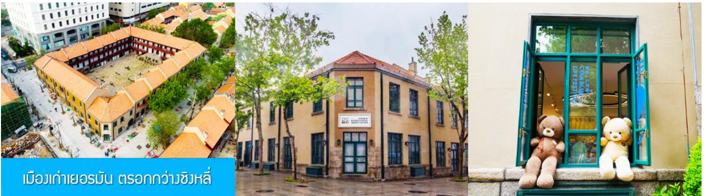
เมืองเก่าเยอรมัน ตรอกกว้างชิงหลี่