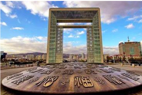
ประตูแห่งโชคกลาง