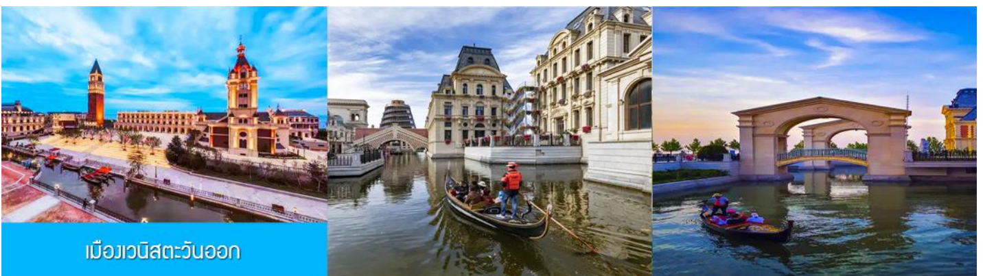
เมืองเวนิสตะวันออก

จากนั้นนำท่านเที่ยวชม เมืองเวนิสตะวันออก 大连东方威尼斯城 เป็นเมืองเวนิสจำลองที่ถูกสร้างขึ้นด้วยทุนกว่า 8,000 ล้านบาท ออกแบบโดยบริษัท ARC จากประเทศฝรั่งเศส โดยจำลองผังเมืองเวนิสในประเทศอิตาลี