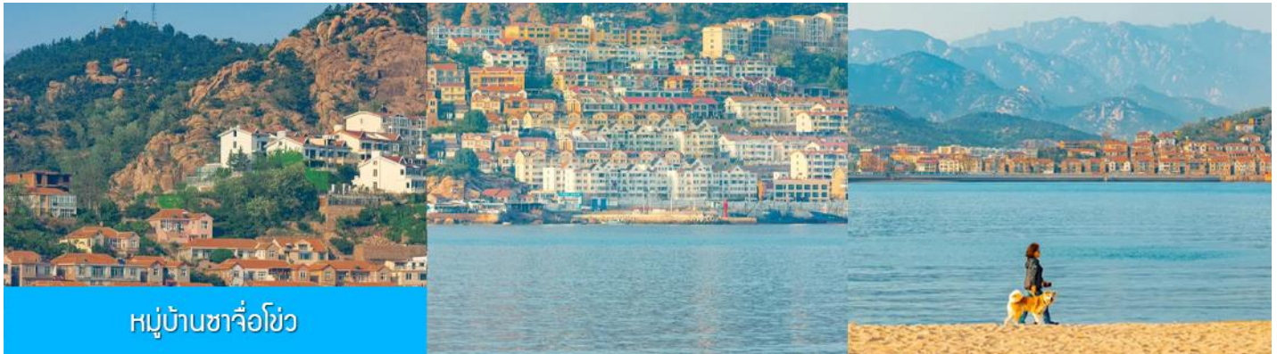
หมู่บ้านซาจื่อโข่ว

เช้า รับประทานอาหารเช้า ณ ห้องอาหารของโรงแรม (4)