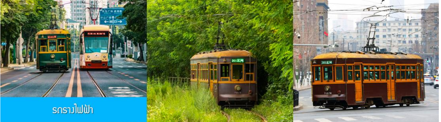
รถรางไฟฟ้า