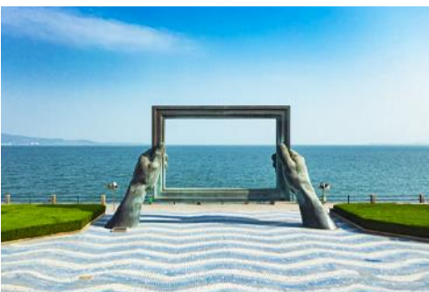
กรอบรูปวิวทะเล

เช้า รับประทานอาหารเช้า ณ ห้องอาหารของโรงแรม (7)