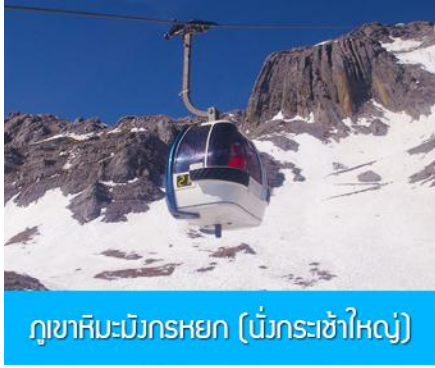
ภูเขาหิมะมังกรหยก (มังกรเข้าใหญ่)