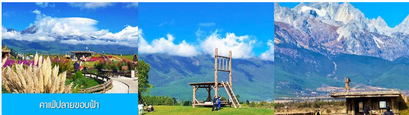
คาเฟ่ปลายขอบฟ้า

เที่ยง รับประทานอาหารกลางวัน ณ ภัตตาคาร (2)