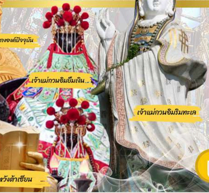
เจ้าแม่กวนอิมยืมเงิน