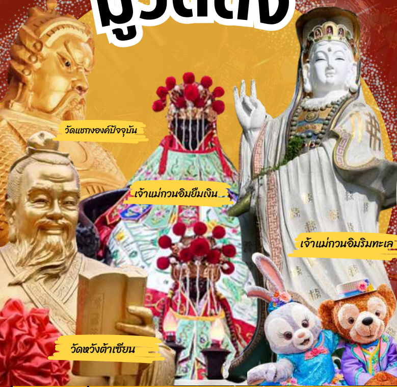
วัดแห่งองค์ปัจจุบัน