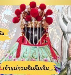
เจ้าแม่กวนอิมฮิมเงิน