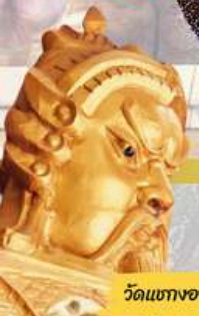
วัดแห่งองค์ปัจจุบัน