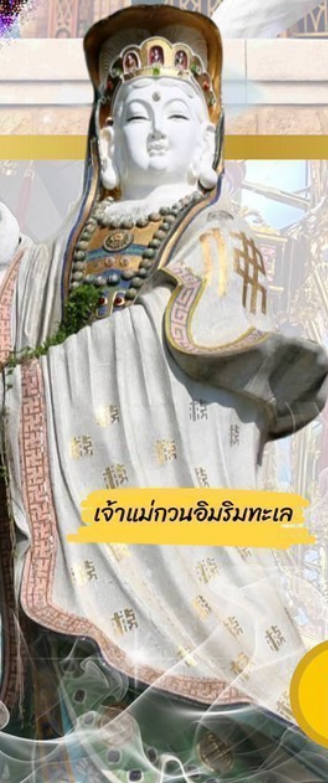
เจ้าแม่กวนอิมวิมทะเล