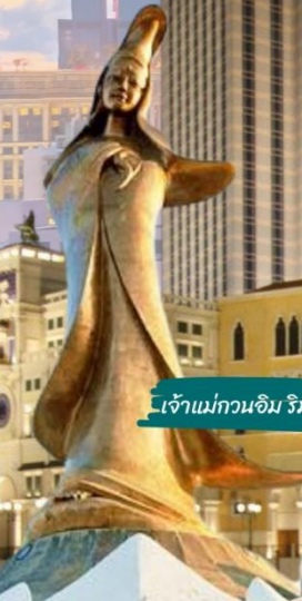
เจ้าแม่กวนอิม ริมทะเล