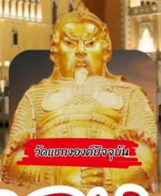
วัดแบงองค์ปัจจุบัน