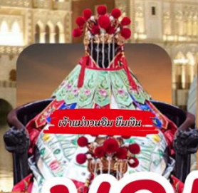
เจ้าแม่กวนอิม ซิมตัน