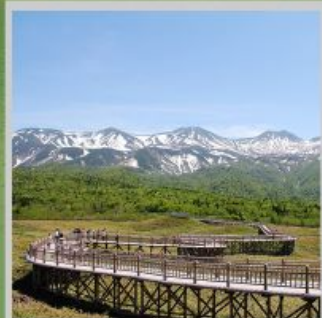
"SHIRETOKO 5 LAKES"