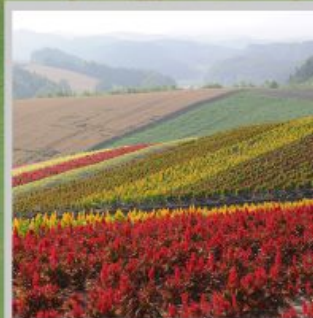
"SHIKISAI NO OKA"