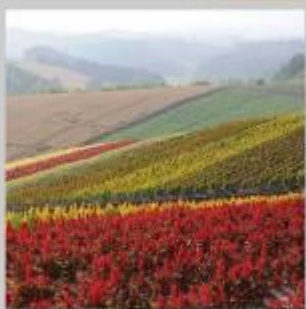
"SHIKISAI NO OKA"