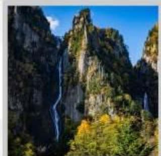
"GINGA & RYUSEI FALLS"

ต้นดา "ทุ่งดอกพืชมอส ณ สวนดอกชิบะซากุระ-อิงะชิโมะโคะโคะ" ด้วยพรมสีชมพูที่มีพื้นที่ขนาดใหญ่ถึง 100,000 ตารางเมตร ชม "ทะเลสาบคาบสมุทรชิเรโตโก" เกิดมาจากการระเบิดของภูเขาไฟโอเอและน้ำพุใต้ดิน จนเกิดเป็นทะเลสาบทั้ง 5 ของชิเรโตโก "ฟาร์มสุนัขจิ้งจอกฮอกไกโด" ฟาร์มสุนัขจิ้งจอกแห่งเดียวของเกาะฮอกไกโด สายพันธุ์ท้องถิ่นคือ สายพันธุ์ Ezo red fox เพลิดเพลินกับ "เนินสีฤดู" เนินเขากว้างใหญ่ที่มีดอกไม้ไม้บานาพันธุ์นับ 30 ชนิดปลูกเรียงรายสลับสีกันเป็นแนวยาว นำท่าน "นั่งกระเช้าภูเขาคุโรดะเคะ" เชื่อมจากเชิงเขาของเมืองโซอุนเคียวถึงยอดเขาคุโรดะเคะที่มีความสูงถึง 670 เมตร ไฮไลท์ "ส่องเรือราอูสี ชมความงามของวาฬเพชฌฆาต" บริเวณคาบสมุทรชิเรโตโก มรดกโลกทางธรรมชาติของฮอกไกโด