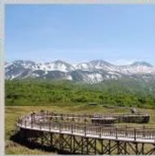
"SHIRETOKO 5 LAKE"