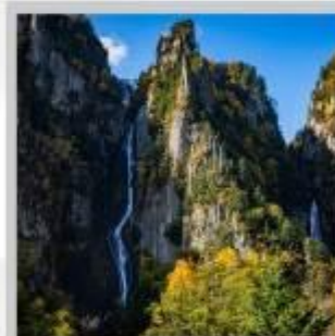
"GINGA & RYUSEI FALLS"

สัมผัสความสวยงามของดอกไม้ "ดอกทิวลิป ณ สวนคะมิยูเบตสึ" ที่มีมากกว่า 120 สายพันธุ์ เพลิดเพลินกับ "ถ้ำน้ำแข็งโอช พาวริเลียน" ที่มีหยดน้ำแข็งรูปร่างสวยงามต่างๆ ที่อุณหภูมิ -20 องศา "ฟาร์มสุนัขจิ้งจอกฮอกไกโด" ฟาร์มสุนัขจิ้งจอกแห่งเดียวของเกาะฮอกไกโด สายพันธุ์ท้องถิ่นคือ สายพันธุ์ Ezo red fox ชมกระท่อมไม้หลังน้อยในดินแดนเทพนิยาย ณ "หมู่บ้านนิงเกิ้ลเทอร์เรซ" จำหน่ายสินค้าจำพวกงานฝีมือต่างๆ นำท่านขึ้นชมวิวมุมสูง "นั่งกระเช้าภูเขาไฟโมอิวะ" เพื่อชมทัศนียภาพของเมืองซัปโปโรจากมุมสูง ชม "ทุ่งดอกพืชมอส ณ สวนทาคิโนะฮุเอะ" ด้วยพรมสีเขียวที่มีพื้นที่ขนาดใหญ่ถึง 100,000 ตารางเมตร