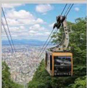
"MT. MOIWA ROPEWAY"