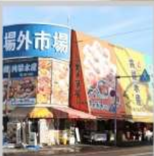
"JOGAI FISH MARKET"