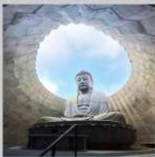
"HILL OF BUDDHA"