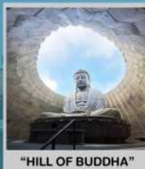
"HILL OF BUDDHA"