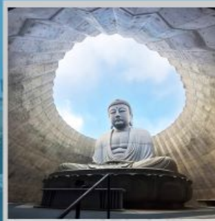
"HILL OF BUDDHA"