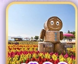
สวนซิกิไซโนะโอกะ