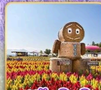
สวนซึกิไซโนะโอกะ