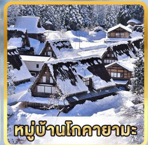
หมู่บ้านโกลายามะ