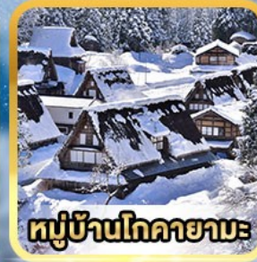
หมู่บ้านโกคายามะ

ราคาเริ่มต้น (รวมภาษีมูลค่าเพิ่ม 7% (ค่าบริการ))