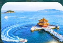
สะพานฉานเฉียว