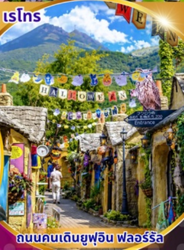
ถนนคนเดินยูฟูอิน ฟลอร์ริล