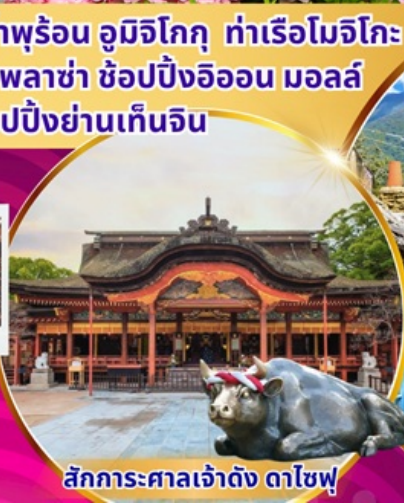
สักการะศาลเจ้าดัง ดาไซฟู