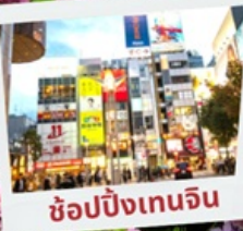
ช้อปปิ้งเทนจิน