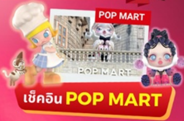
เช็किन POP MART