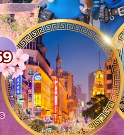
ถนนคนเดินหนานจิง