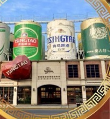
โรงงานเบียร์ชิงเต่า