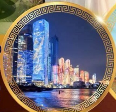
No.3 Bathing Beach

ลานจัดงานเบียร์ชิงเต่า Golden Beach ทางเดินไม้ริมทะเล ศาลเจ้าเทพทะเล ถนนคนเดินโตตง พิพิธภัณฑ์เทศบาลชิงเต่า สวนสาธารณะซิกแนลฮิลล์ ถนนหลงเจียงสู่ กระเช้าเขาไท่ผิง ยาน Da Bao Island โบสถ์ st.Michael's Cathedral ถนนจงซาน ถนนคนเดินฟิลาญยวน จัตุรัสเบียร์