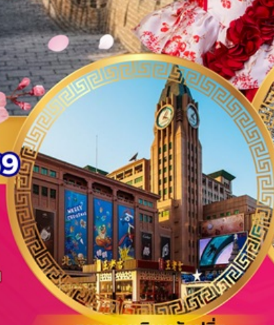
ถนนคนเดินหวังฝูจิ่ง

เที่ยวย่านการค้าดังกลางกรุงปักกิ่ง ถนนคนเดินหวังฝูจิ่ง จัตุรัสเทียนอันเหมิน พระราชวังกุ๊กกิง หอฟ้าเทียนถาน ช้อปปิ้งย่านซานหลี่ถุน พระราชวังฤดูร้อนอวี่เหอหยวน กำแพงเมืองจีนด่านอวิหยงกวน ชมซากุระบาน สักการะวัดลามะ