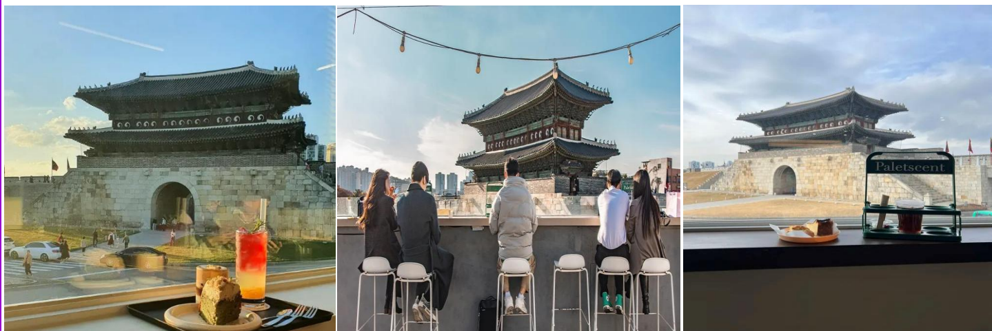
เห็นป้อมฮวาซองได้แบบ 180 องศา เป็นอีกหนึ่งสถานที่เดทอยอดฮิตของหนุ่มสาวชาวเกาหลีด้วย

ลงโทษโดยการชังองค์ชายไว้ในถังข้าวและให้ถอดข้าวอดน้ำ พอผ่านไป 7 วันจึงสิ้นพระชนม์ภายในถังข้าว กำแพงป้อมฮวาซอง มีความยาวถึง 5.5 กิโลเมตร มีป้อมปราการ หรือประตูเมือง ทั้งหมด 4 ทิศ และมีรูปแบบทางสถาปัตยกรรมที่ยิ่งใหญ่และงดงาม จากนั้นนำท่านสู่ Café Paletscent ร้านกาแฟในเมืองซูวอนที่มีมุมถ่ายรูปชิค ๆ หลายมุม บนชั้นสองของร้านสามารถมองเห็นวิวประตูจางอันมุน ประตูฝั่งทางด้านทิศเหนือของป้อมฮวาซอง และในส่วนของชั้น3 ชั้นคาเฟ่เป็นอีกมุมที่สายคอนเทนต์ สายถ่ายรูปห้ามพลาด สามารถถ่ายรูปออกมา