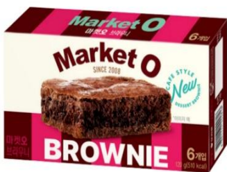
Market O Real Brownie (20g x 6cookie)