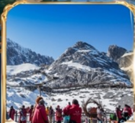
ภูเขาหิมะมังกรหยก +กระเช้าใหญ่