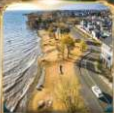
ทะเลสาบเอ่อไห่ โค้งตัว S