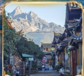
เมืองโบราณซูเหอ