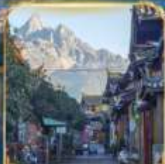
เมืองโบราณซูเหอ