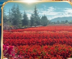
สวนดอกไม้ HUA YU MU CHANG