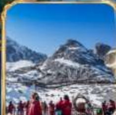
ภูเขาหิมะมังกรหยก +กระเช้าใหญ่