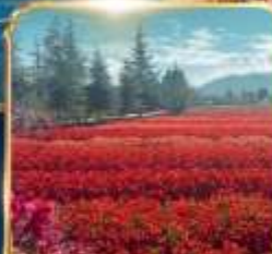
สวนดอกไม้ HUA YU MU CHANG