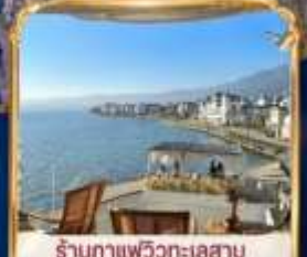
ร้านกาแฟวิวทะเลสาบ BAN SHAN YUE (รวมค่าเช่า ไม้ระแนงห้องชั้น และค่าเช่าเตียงกำขรุบ)