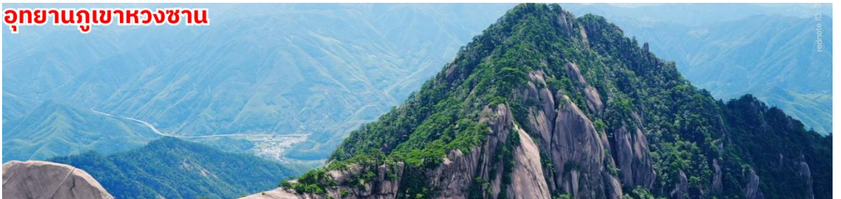
อุทยานภูเขาหวงซาน

กลางวัน 101 บริการอาหารกลางวัน ณ ภัตตาคาร จากนั้นนำท่านเดินทางสู่ ภูเขาหวงซาน (Huangshan หรือ Yellow Mountain) ตั้งอยู่ในเขตมณฑลอันฮุย ทางตะวันออกของจีน ความสูงประมาณ 1,864 เป็นภูเขาที่ได้รับการยกย่องว่าสวยงามที่สุดในประเทศจีนและเป็นมรดกโลก Unesco มีความโดดเด่นด้วยยอดเขาหินแกรนิตรูปทรงแปลกตาและสูงตระหง่าน ซึ่งเกิดจากกระบวนการกัดเซาะของธรรมชาติเป็นเวลาหลายปี ต้นสนโบราณที่เติบโตบนหน้าผาสูงชัน หนึ่งในสัญลักษณ์สำคัญของที่นี่ โดยเฉพาะ “สนรับแขก” ที่นักท่องเที่ยวนิยมมาถ่ายรูป ทะเลหมอก สีขาวลอยคลุมยอดเขา สวยราวภาพวาดจีนโบราณ โดยเฉพาะหลังฝนตกหรือช่วงเช้า จุดชมวิวอย่าง Bright Summit และ Beihai Scenic Area คือจุดยอดนิยมสำหรับเก็บภาพแสงทองเหนือทะเลหมอก กระเช้าชมวิวกาโนรามานั่งกระเช้าขึ้น-ลงสู่ยอดเขา ชมวิวมุมสูงแบบ 360 องศา