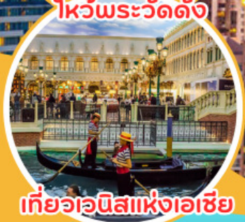
เที่ยวเวนิสแห่งเอเชีย