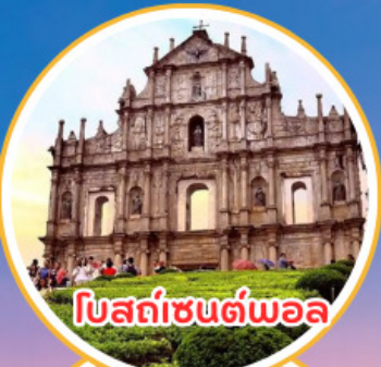
โบสถ์เซนต์พอล