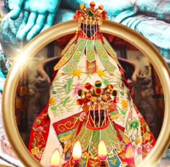
เยี่ยมเงินเจ้าแม่กวนอิมสองฮา