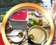
บุฟเฟ่ต์ชาบู เสิร์วิสอิน!!