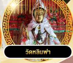
วัดหลิวฟา