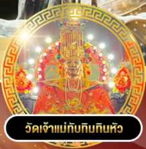
วัดเจ้าแม่กวนอิมพันมือ