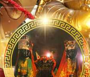
วัดบ้านโคม