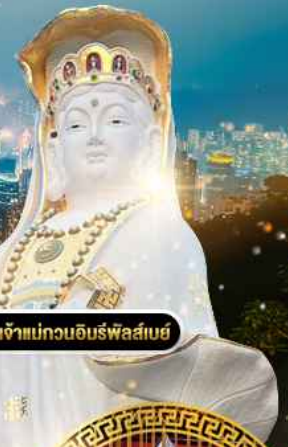
วัดเจ้าแม่กวนอิมรับเสด็จ