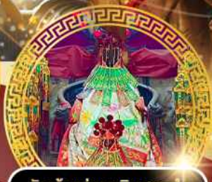
วัดเจ้าแม่กวนอิมสองอ้า