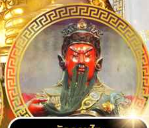
วัดกวนโก