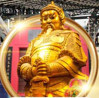
วัดเขกงหนิว