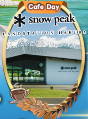
Snow Peak Land Hakuba