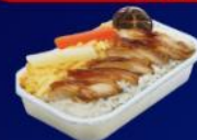
ข้าวหน้าไก่ย่างเทรียก

บริการอาหารร้อน และ น้ำดื่ม บนเครื่อง ขาไป และ ขากลับ