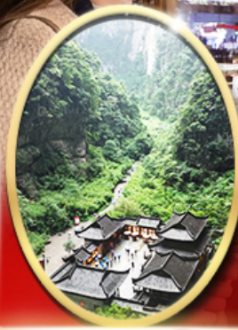
อุทยานหลุมฟ้า สะพานสวรรค์