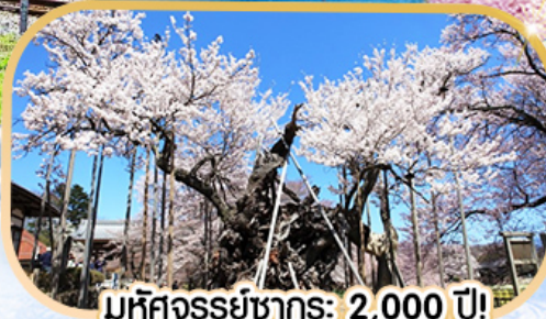
มทศวรรษซากุระ: 2,000 ปี!