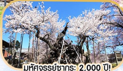
มหัศจรรย์ซากุระ: 2,000 ปี!