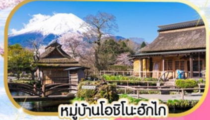
หมู่บ้านโอชิโนะฮักไก