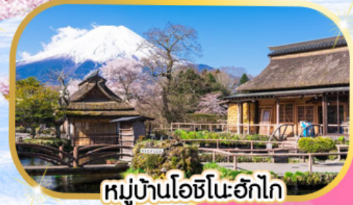
หมู่บ้านโอชิโนะฮักไก