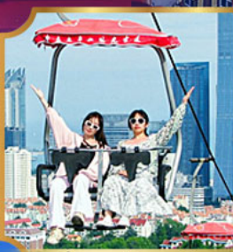
นั่งกระเช้า ชมเมือง