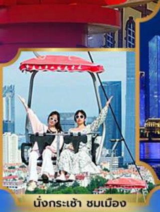
นั่งกระเช้า ชมเมือง