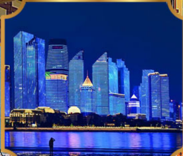
หาดเซเบอร์ฟังก์