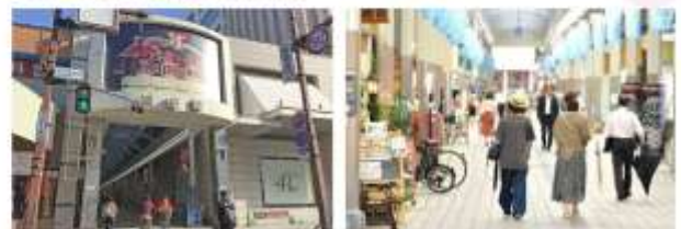
SHOPPING AT SOGAWA DORI STREET