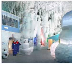
พิพิธภัณฑน์น้ำแข็ง