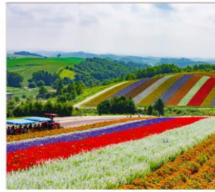
ทุ่งดอกไม้หลากสี