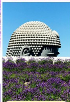
เนินพระพุทธรเจ้า