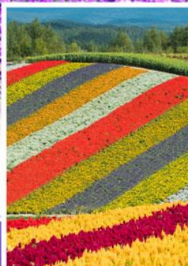
ทุ่งดอกไม้หลากสี