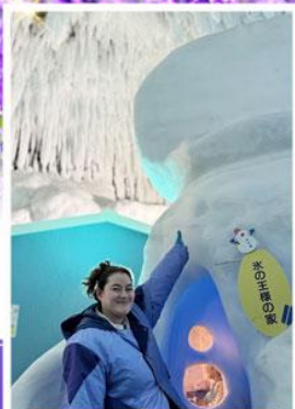
พิพิธภัณฑ์น้ำแข็ง