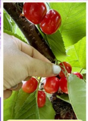
กิจกรรมเก็บเชอร์รี่