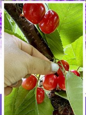
กิจกรรมเก็บเชอร์รี่

ออนเซ็น 2 คืน นน.กระเป๋า 23 กก. 1ใบ 6Days 4Night