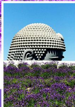
เนินพระพุทธรเจ้า