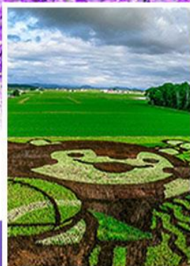
ศิลปะบนทุ่งข้าว