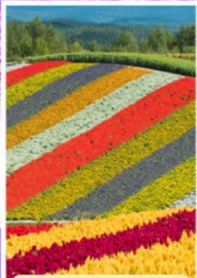
ทุ่งดอกไม้หลากสี