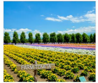
ทุ่งลาเวนเดอร์โทมิตะ