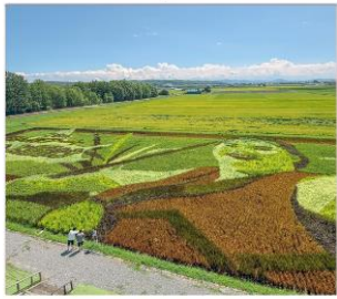
ดิลปะบนทุ่งนา