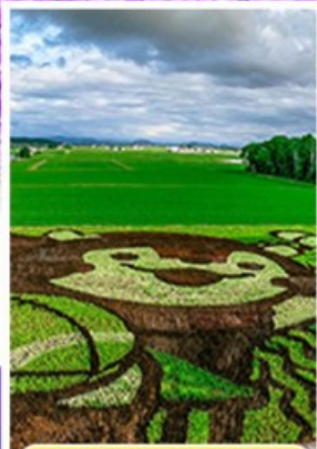
ศิลปะบนทุ่งข้าว