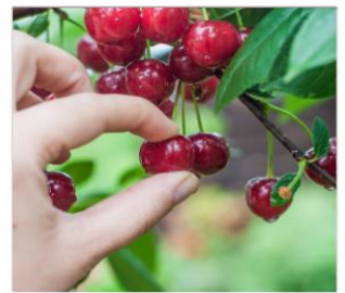
กิจกรรมเก็บเชอร์รี่