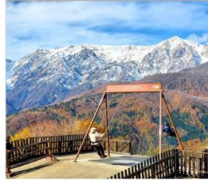
ฮาคุนะอิวาทาเกะ