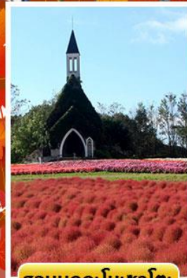
สวนบกกะโนะซาโตะ