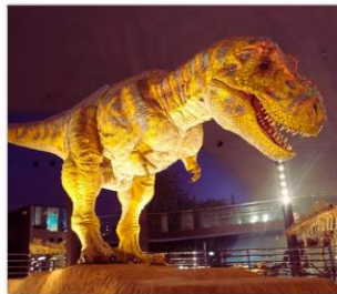
พิพิธภัณฑ์ไดโนเสาร์