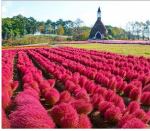
สวนดอกไม้บักกะโนะซาโตะ