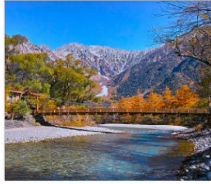
ดามิโดจิ