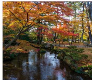
สวนเคนโรคุเอ็น