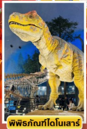
พิพิธภัณฑ์ไดโนเสาร์