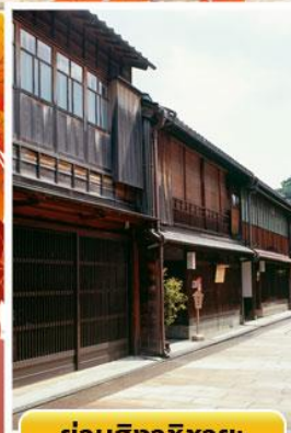
ย่านอิงาชิบายะ