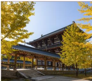
วัดไดชิซังเซอิโดจิ