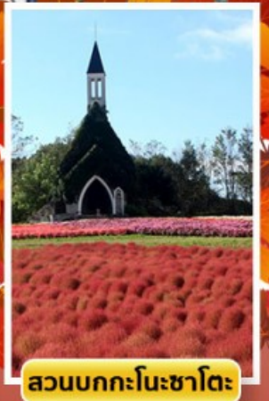
สวนบกกะโนะซาโตะ