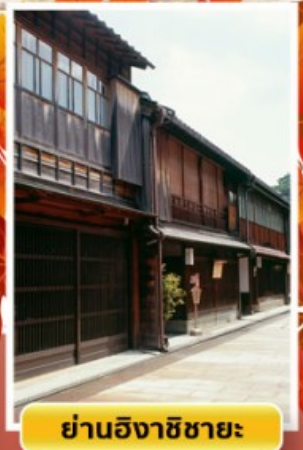
ย่านอิงาชิบายะ