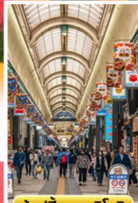
ช้อปปิ้งทานุกิโคจิ