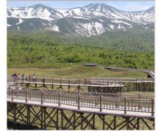
ทะเลสาบทั้ง5ชิเรโตโกะ