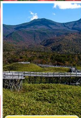
เส้นทางชิโรโตเกะ