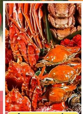
ปิ้งย่างพรีเมี่ยม

ออนเซ็น 2 คั้น นน.กระเป๋า 23 กก. 6Days 4Night