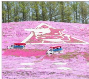
ฮิกาชิมโโกโตะ(พื้งมอส)