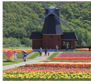
ดามิยูเม็ตสึ(ทิวลิป)