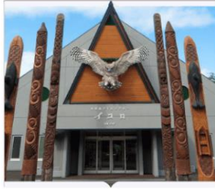
หมู่บ้านไอนุโคตัน