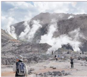
ปล่องภูเขาไฟอิโ