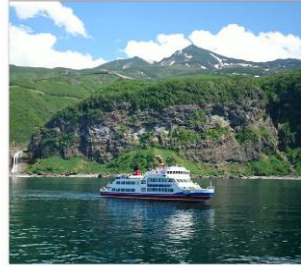
ล่องเรือแควลมชิเรโตโกะ