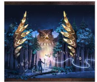
kamui lumina night