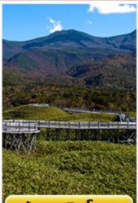
เส้นทางชิเรโตเกะ