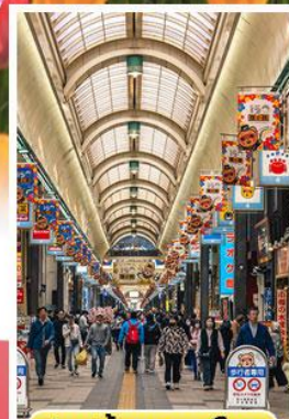
ช้อปปิ้งทานุกิโคจิ