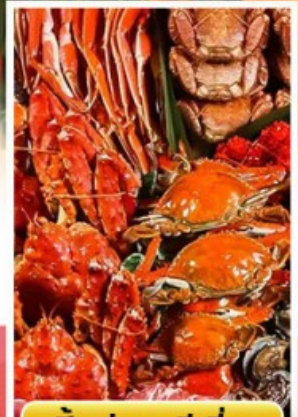
ปิ้งย่างพรีเมียม