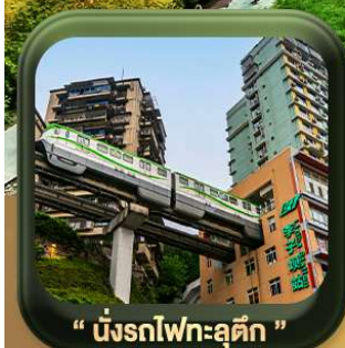
“ นิ่งรถไฟทะเลลัด ”