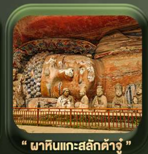
“ ภาหิมแกะสลักต้าจู้ ”

วันเดินทาง มี.ค. - ต.ค. 2569 ราคาเริ่มต้น 22,999.-