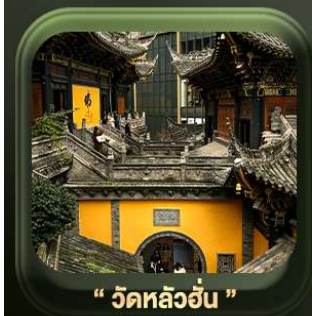
“ วัดหลิวอัน ”