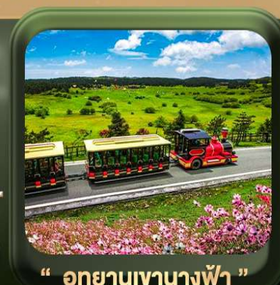
“ อุทยานเขานางฟ้า ”