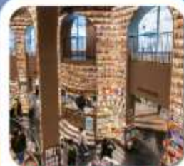
"ห้องสมุดจงซูเก๋"