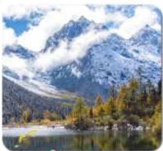
"ปี้เผิงโกว"

ชมความงาม 2 อุทยาน • สี่ดรุณี ของเฉียวโกว • ปี้เผิงโกว • พระใหญ่เล่อซาน สะพานหนานเจียว น้ำตาสีฟ้า • ห้องสมุดสุดเก๋ จงซูเก๋ • แพนด้ายักษ์ฉินอันเซอพี ขอยกว้างชอยแคบ • ถนนคนเดินชุนซีส์ • แพนด้ายักษ์บีบีตีก • ถนนคนเดินจันหลี่