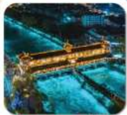
"สะพานหนานเจียว"