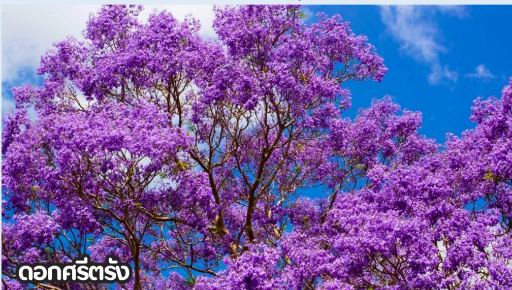
ดอกครีตั่ง

จากนั้น นำทุกท่านเดินทางชมดอกไม้ตามฤดูกาล (ปลายเดือนเมษายน - พฤษภาคม) : ชมดอกแจคคาเรนต์้าหรือดอกครีตั่ง เมื่อใกล้ถึงฤดูร้อน หมู่มณฑล ดอกดอกแจคคาเรนต์้า (Jacaranda) สีม่วงบานสะพรั่งในเมืองคุนหมิง มองเห็นเป็นกลุ่มเมฆสีม่วงโอบล้อมทั่วทั้งท้องถนนทำให้ทั้งเมืองดูเหมือนดินแดนแห่งความฝันอันเจียบสงบ ชมดอกสีตั่งสีม่วง และ นั่งรถรางหรือรถบัสชมดอกครีตั่ง (Jacaranda) ประมาณ 30 นาที (รวมรถราง) หรือหลานฮวาหนิง ที่คุนหมิง เป็นไฮไลท์ยอดฮิตช่วงเดือนเมษายน-พฤษภาคม โดยเฉพาะที่ถนนเจียวฉางจงลู่ (Jiao Chang Zhong Lu) ซึ่งเป็นอุโมงค์ดอกไม้สีม่วงยาวกว่า 2 กม. บรรยากาศโรแมนติกคล้ายยุโรป โดยนักท่องเที่ยวนิยมเดินชมและถ่ายรูปตามแนวแม่น้ำผานหลงด้วย