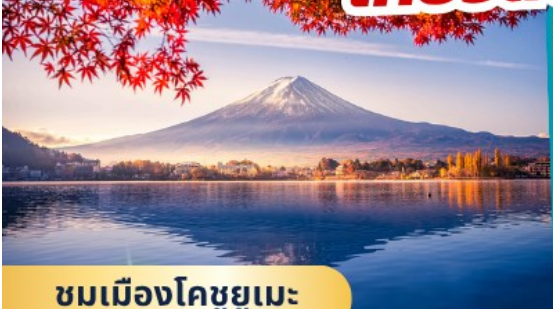
ชมเมืองโคชูยูเมะ