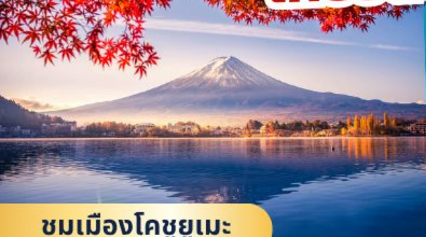
ชมเมืองโคชูยูเมะ