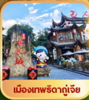
เมืองเทพริดาตุ๋เจีย