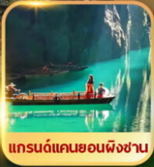
แกรนด์แคนยอนผิงชาน